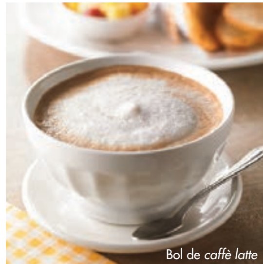
Bol de caffè latte