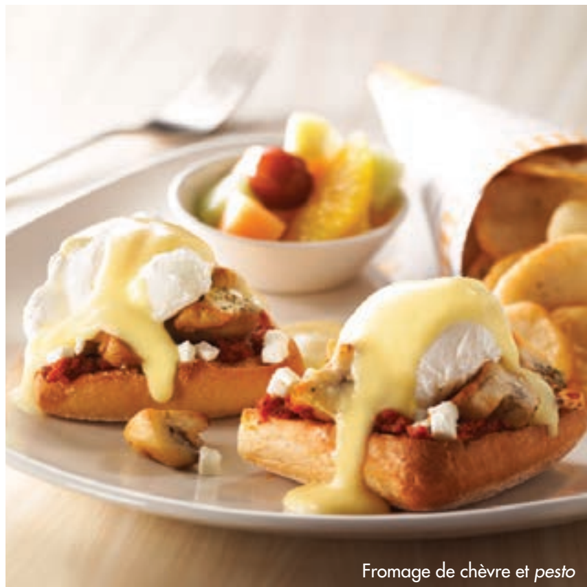
Fromage de chèvre et pesto

Avec tous ces déjeuners, le duo mattino *, les pommes de terre, le café ou le thé et le choix entre salade de fruits ou tomates et laitue sont inclus. Vous pouvez également profiter du Bar à Pain, où tartinades et confitures vous sont offertes à volonté.