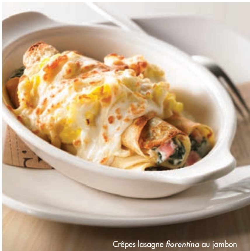
Crêpes lasagne fiorentina au jambon