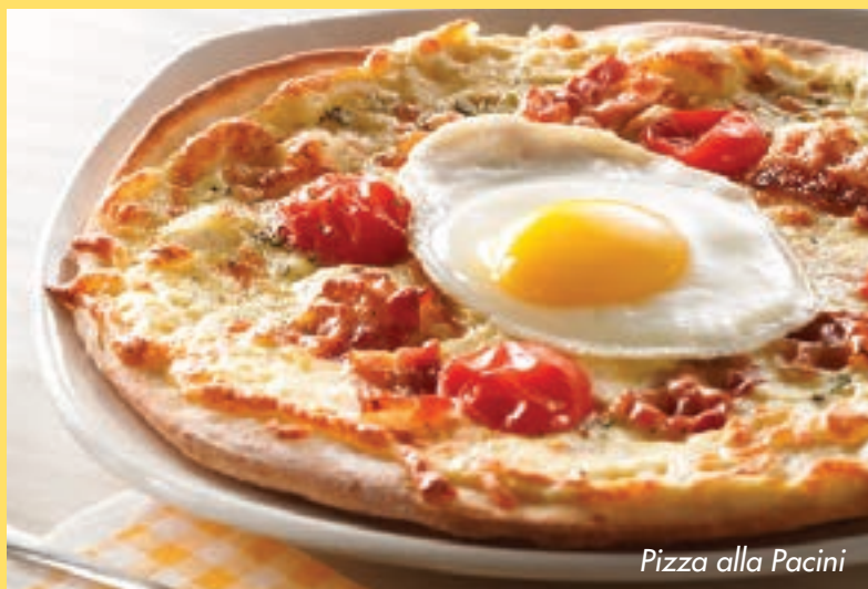
Pizza alla Pacini

Petite pizza, tartinade à la noisette et au cacao. 8,50 $