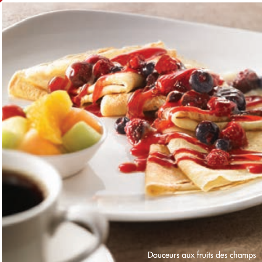
Douceurs aux fruits des champs