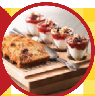
Gaufre aux fruits des champs

Pain à la canneberge, aux raisins et à l'abricot, fait à base de yogourt et accompagné d'une verrine de yogourt garnie de fruits des champs et de granolas au miel. Un savoureux départ!