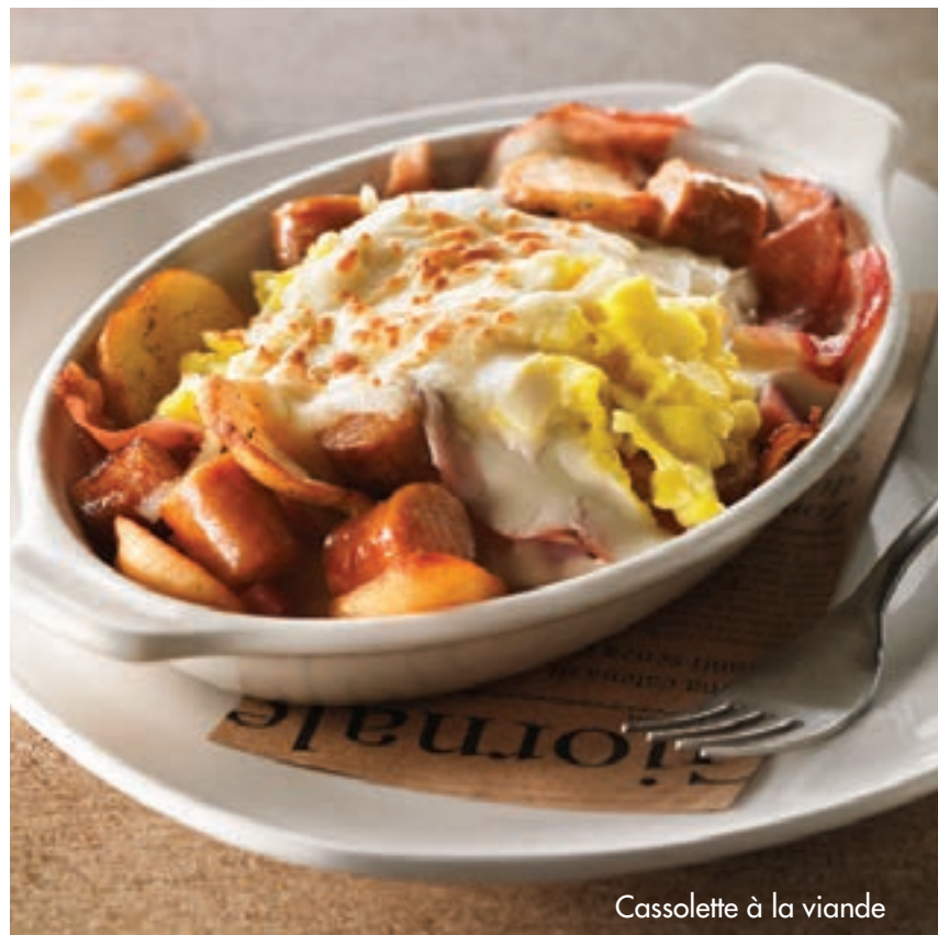
Cassolette à la viande

Avec tous ces déjeuners, le duo mattino * et le café ou le thé sont inclus. Vous pouvez également profiter du Bar à Pain, où tartinades et confitures vous sont offertes à volonté.