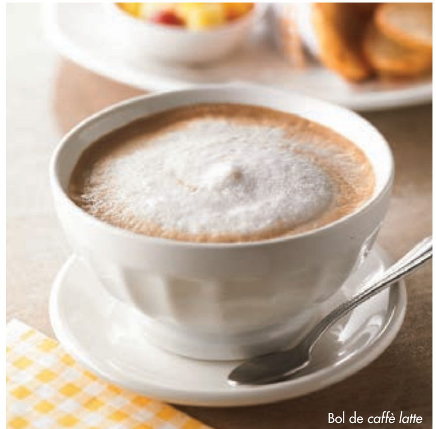
Bol de caffè latte

Tous nos déjeuners sont sans gras trans artificiels.