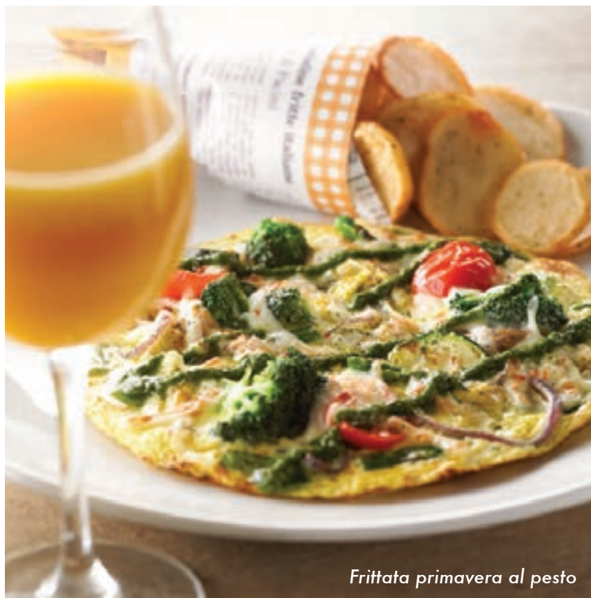
Frittata primavera al pesto